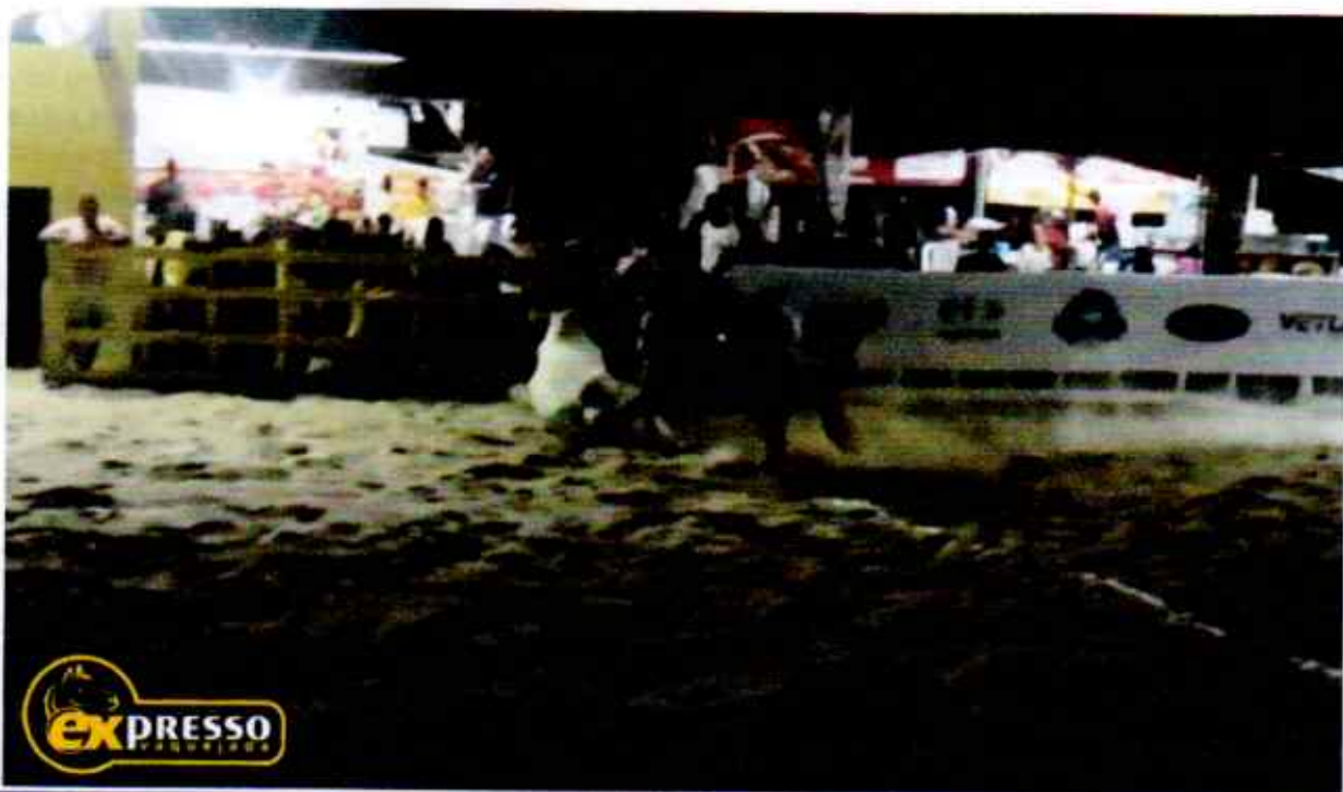
4. Neste frame 4, as imagens mostram que as partes superiores do corpo do boi já passaram da 1ª faixa de pontuação, sem tocar na faixa.