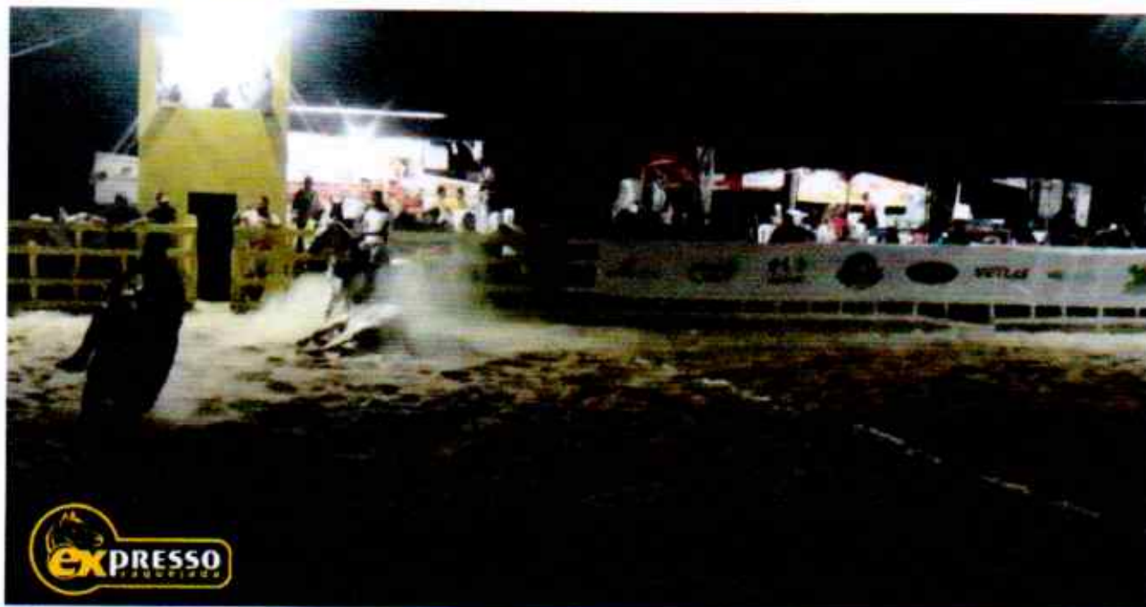
5. Aqui o boi se soltou completamente entre as faixas de pontuação.