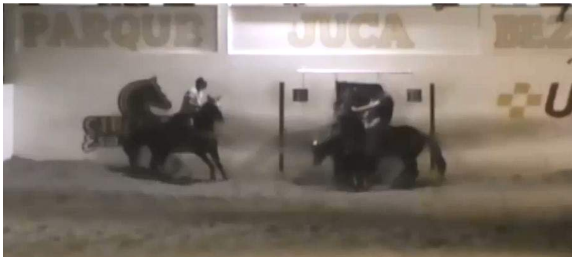
1. Saída do brete normal.

Em análise técnica, realizada com as imagens oficiais do evento citado pelo solicitante, e conforme consta do regulamento geral de vaquejada da ABVAQ, publicado no Diário Oficial da União em 17 de agosto de 2017, por recomendação do Ministério da Agricultura, por entender que este regulamento atende os requisitos necessários para a preservação do bem estar animal em eventos dessa natureza, chegamos a conclusão que: