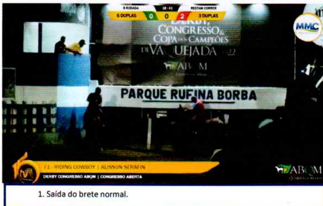
1. Saída do brete normal.

Em análise técnica, realizada com as imagens oficiais do evento citado pelo solicitante, e conforme consta do regulamento geral de vaquejada da ABVAQ, publicado no Diário Oficial da União em 17 de agosto de 2017, por recomendação do Ministério da Agricultura, por entender que este regulamento atende os requisitos necessários para a preservação do bem estar animal em eventos dessa natureza, chegamos a conclusão que: